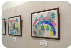
絵画の小径に飾られた 保育園児の作品

待ち時間を少なくするために、採血室や混んでいる外来に看護師が応援に行くなど、外来看護師間で協力し合いながら業務をおこなっておりますが、患者様にはお待ちいただくことがあり大変ご迷惑をおかけしております。