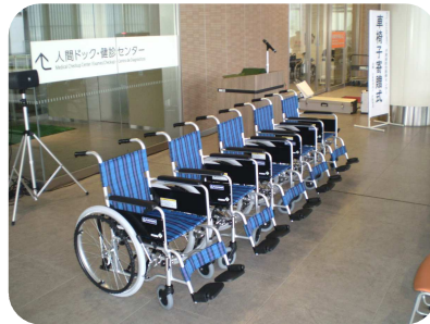
寄贈された車いす