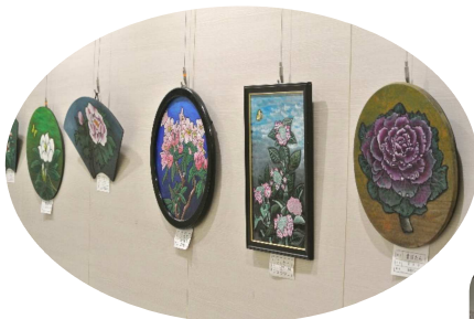
美しい碑文谷彫りの作品

また、「こんなこと、あんなことを待ち時間にできたらいいな」というご意見がありましたら、投書箱へお願いいたします。