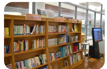
当院2階 図書コーナー

いただいた車いす・図書は大切に使用させていただきます。寄贈ありがとうございました。