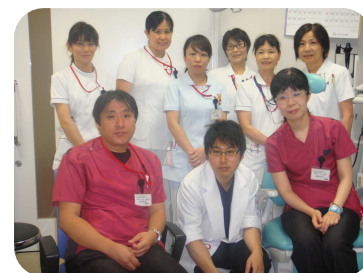
耳鼻いんこう科の医師及びスタッフ

今後も中東遠地区耳鼻いんこう科診療の中核となれるよう努力していくつもりです。よろしくお願ひいたします。