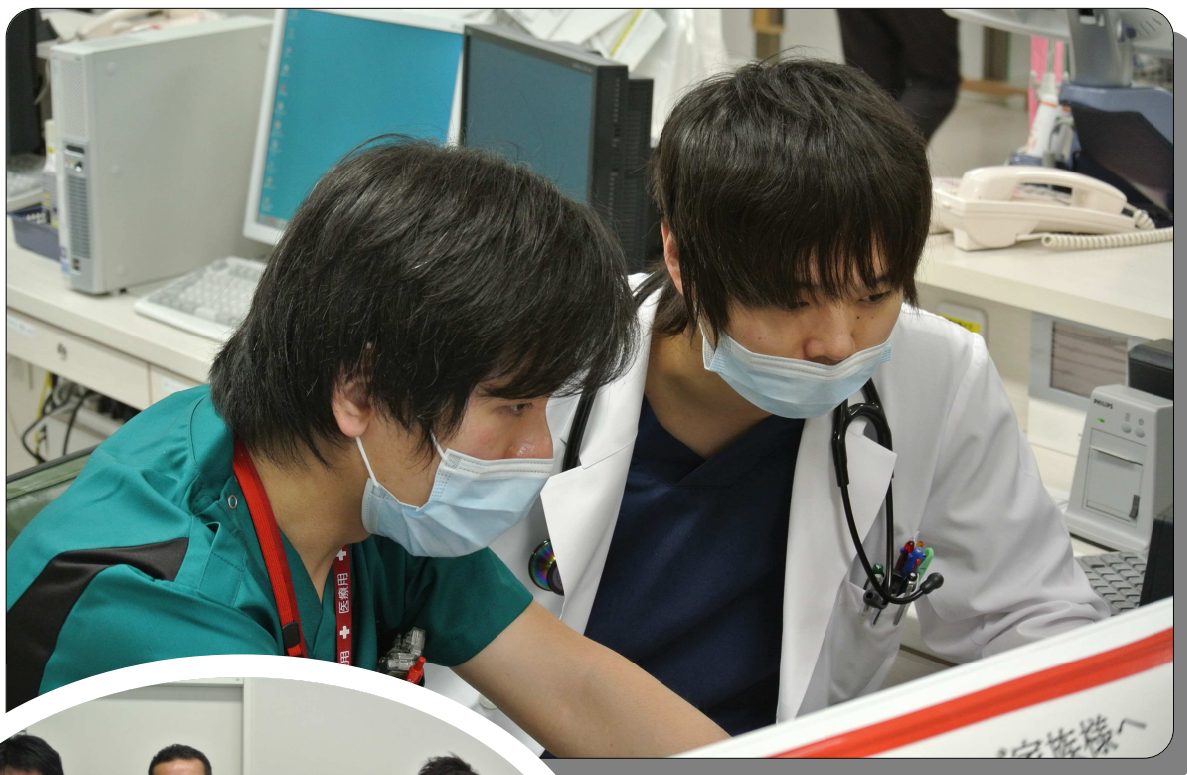
医師の指導を受ける2年目研修医