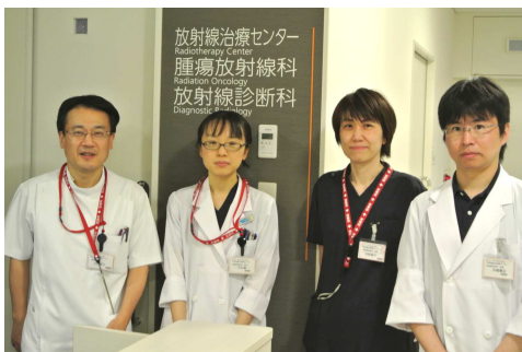
放射線診断科医師

中東遠地区で初めてPET-CT(Time of Flight機能付きの最新型)が導入されました。また最新の3テスラのMRI(磁気共鳴)装置(肝弾性率測定機能付き)、最新CT(コンピューター断層)装置(2管球のdual energy、血管撮影装置連動システム付き)が導入されています。最新の血管撮影装置を使用して肝腫瘤などに対する動注塞栓療法、外傷性出血、喀血、脾機能亢進症などに対する塞栓療法などのカテーテル治療を施行しています。