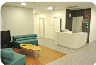
腫瘍放射線科の患者様待合室