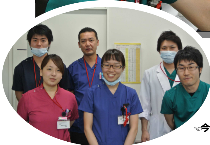
今年度は6名の研修医を採用しました