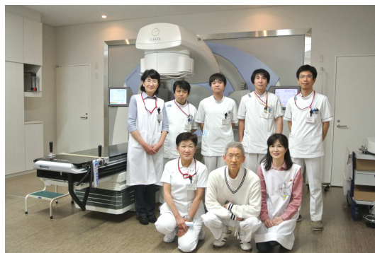
腫瘍放射線科医師とスタッフ

御存じのとおり、放射線治療は、手術、化学療法とならんで癌治療の3本柱の一つであり、機能が温存できること、全身の副作用が少ないことが特徴です。これらの特徴から、大部分の癌が治療対象になり、特に高齢者には選択されやすい治療といえます。また、一部の肺癌、子宮癌などでは、治療技術の進歩により放射線治療単独で完治も望めるようになりました。さらに手術や化学療法と組み合わせることによって、それぞれ単独で癌治療を行う場合より、治療効果がさらに高まります。また再発等で治療が望めない場合でも放射線治療は患者さんの癌特有の苦痛を和らげるのにも有効です。このように放射線治療の対象は広いのですが、ただ癌そのものの性質、全身状態、併存疾患の有無などにより放射線治療が不適な場合があります。また放射線治療特有の副作用もありますので、放射線治療を希望される場合はまず主治医と十分にお話し合いされることが必要です。