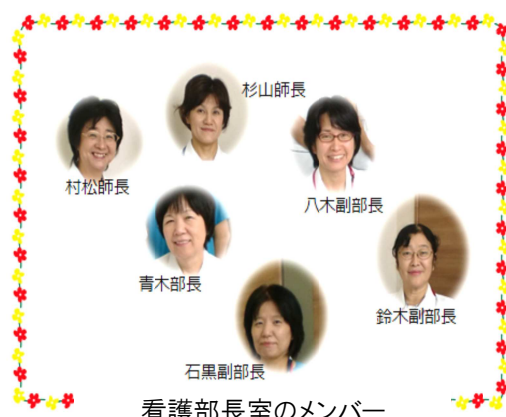
看護部長室のメンバー