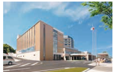
▲北東側からみた新棟外観イメージ

工事・制限に関する詳細は中東遠総合医療センター 病院整備計画特設ページをご覧ください。 https://chutoen-hp.co.jp/byouinseibi.tokusetu/