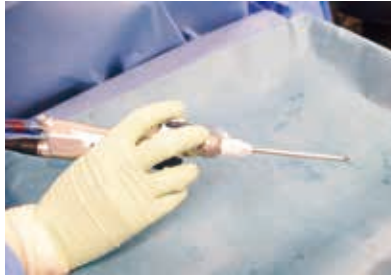
図3: マイクロデブリッター 先端からポリープや炎症組織を吸引しながら清掃できる

(※)磁力を使って医療機器の位置を正確に追跡し、手術や治療の精度を向上させるシステムのことです。