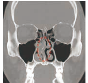
図2: 鼻中隔彎曲症のCT画像 鼻腔を左右に分ける鼻中隔の骨が「く」の字に彎曲して右鼻腔が狭くなっている

鼻中隔彎曲症は、鼻腔を左右に分ける鼻中隔が曲がっている状態で、成長過程での骨や軟骨のズレや外傷が原因となります。これにより、片側または両側の鼻腔が狭くなり、鼻呼吸が困難になります。診断は、内視鏡検査やCT検査で行います。