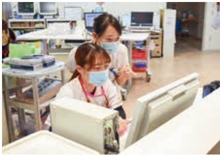
▲病棟で後輩の指導を行う看護師 (手前が後輩)

当院では、入職から段階的にスキルアップできる教育体制を整えています。入職3年目にはリーダー業務についての研修を受け、4年目からは本格的にリーダーとしての役割を担っていきます。メンバーが円滑に業務を進められるよう気を配り、サポートしていくこともリーダー業務の一つです。これには、病棟全体の患者情報やメンバーの業務内容、進行状況を把握することが欠かせません。まだ十分にスタッフの状況を把握しきれず、サポートが不足している場