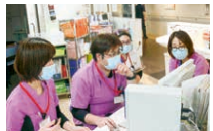
▲退院支援の打ち合わせをする様子