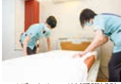
▲メディカルエイド(看護補助者)

※会計年度任用職員(非常勤職員)の募集です。 知識や経験が無くても地域医療に貢献できる魅力ある職種です。