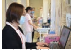
▲医師事務作業補助者