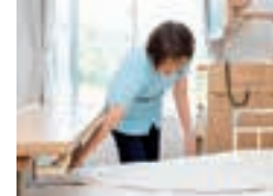
▲ メディカルエイド