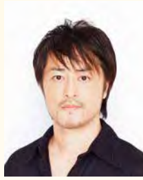
マイクスギヤマ (作詩)