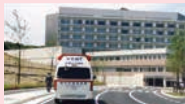
▲ 旧病院から救急車で患者さまを搬送