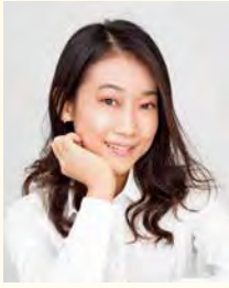
山本 清香 (作曲)