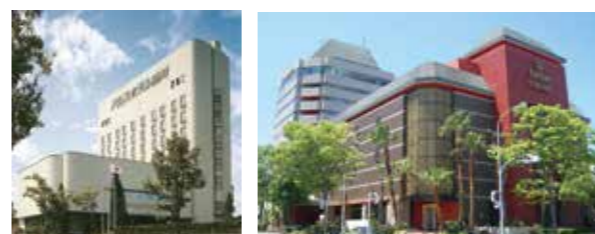
パレスホテル掛川 掛川グランドホテル