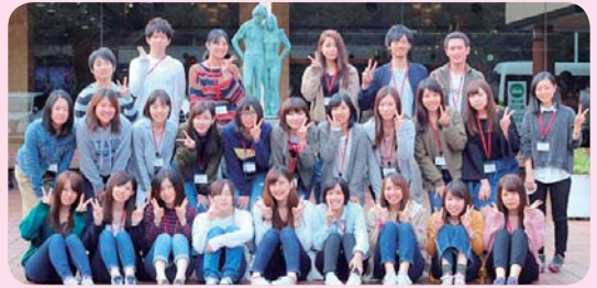
▲ 宿泊研修会場（つま恋）にて