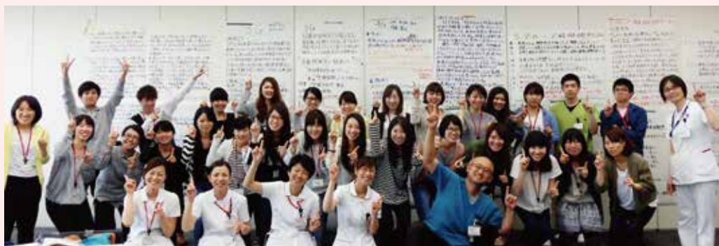
▲2年目の看護師と教育担当職員